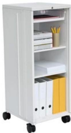
Caddy 1 mit Fachböden

Catering. So kann Caddy als raffiniert elektrifizierter, kleiner und mobiler Steharbeitsplatz, für Konferenzen und Präsentationen mit einem Beamer oder als Helfer zu Cateringzwecken mit massgeschneidertem Innenleben konfiguriert werden.