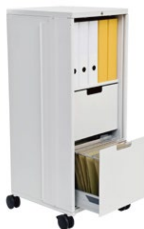
Caddy 2 mit Schubladen